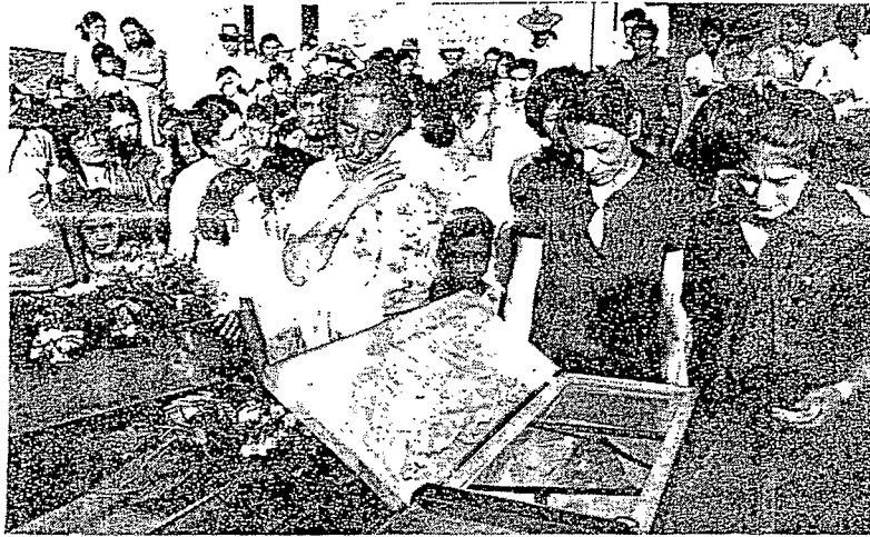
Cientos de víctimas ha cobrado en Nicaragua la guerra secreta que dirige Negroponete desde su embajada en Tegucigalpa.