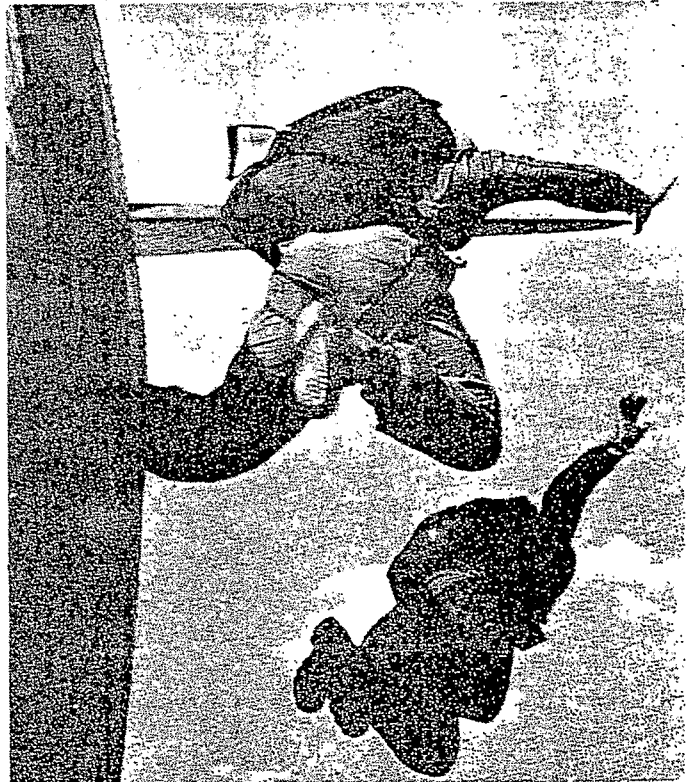
Cientos de asesores civiles norteamericanos desembarcan mensualmente en Honduras.

"The sagacious Machiavellian", as his friends in the "company" characterize him, also served as "security adviser" during those years for the different puppet governments of Saigon and acted as "liaison" in establishing relations between the United States, and the bloodthirsty government of Pol Pot in Cambodia (now Kampuchea), which was responsible for the slaughter of more than 3 million people.